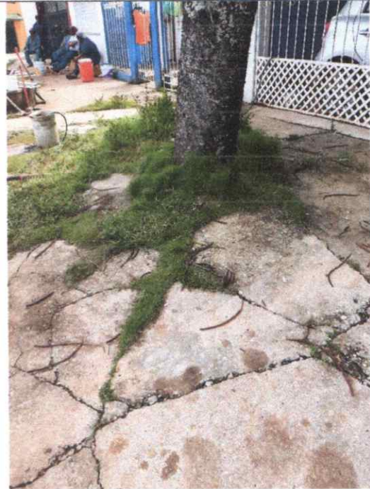
Foto 2. Vista frontal del pino donde se puede apreciar el levantamiento de la banqueta perimetral por las raíces