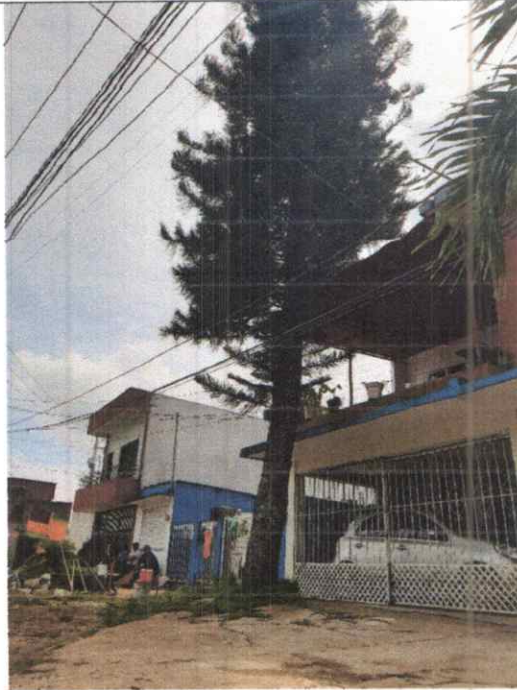
Foto 1. Obstrucción de las ramas y tronco del Pino, obstruyendo el cableado eléctrico y presenta inclinación de 30° aproximadamente hacia la vivienda del ciudadano.